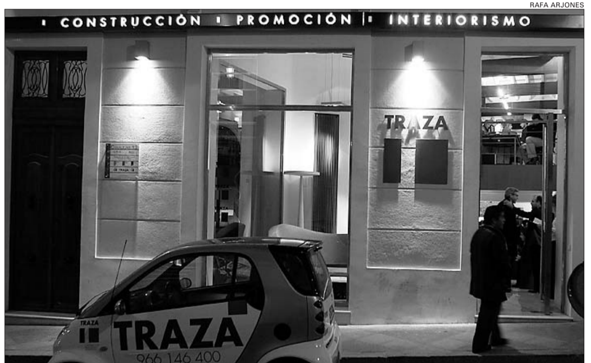
TRAZA se ubica en un edificio rehabilitado en la número 13 de la calle Canalejas

explicar a los asistentes al acto inaugural la filosofía que ha llevado al éxito profesional de la marca. Por un lado, «aunar las nuevas tecnologías con la parte artesanal del oficio, con el trabajo del albañil de toda la vida», aseguraba el director de TRAZA. En segundo lugar, y no menos importante, «habilitar mano de obra cualificada, formar al trabajador». De esta manera, el grupo de empresas que ahora conforma la firma TRAZA se apoya en dos pilares fundamentales, representados en su logotipo. En primer término, «nos basamos en mantener la tradición, realizar una